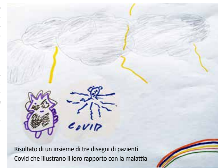
Risultato di un insieme di tre disegni di pazienti Covid che illustrano il loro rapporto con la malattia

Gli incontri, di tipo aperto, sono a cadenza bi-settimanale in una