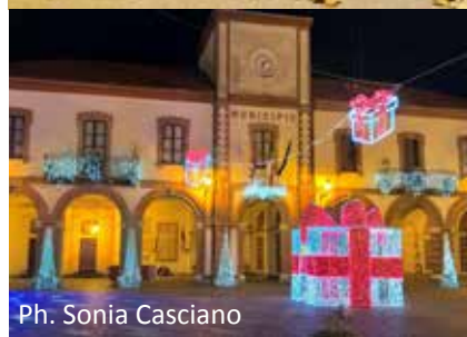
Ph. Sonia Casciano