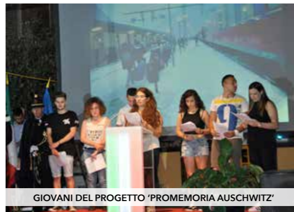
GIOVANI DEL PROGETTO 'PROMEMORIA AUSCHWITZ'