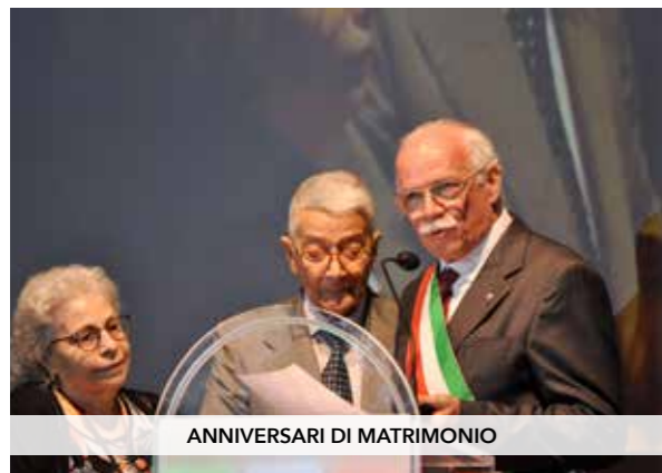
ANNIVERSARI DI MATRIMONIO