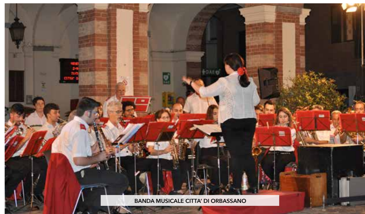
BANDA MUSICALE CITTA' DI ORBASSANO