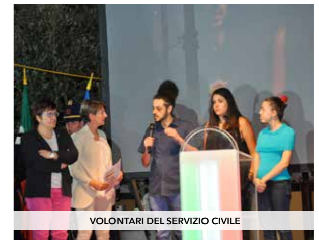
VOLONTARI DEL SERVIZIO CIVILE