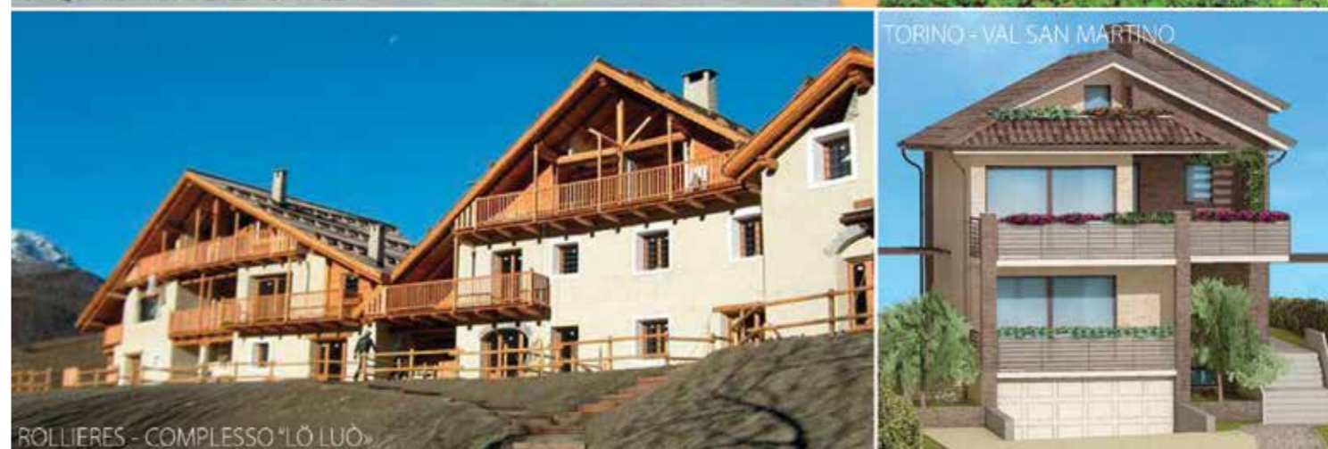
TORINO - VAL SAN MARTINO