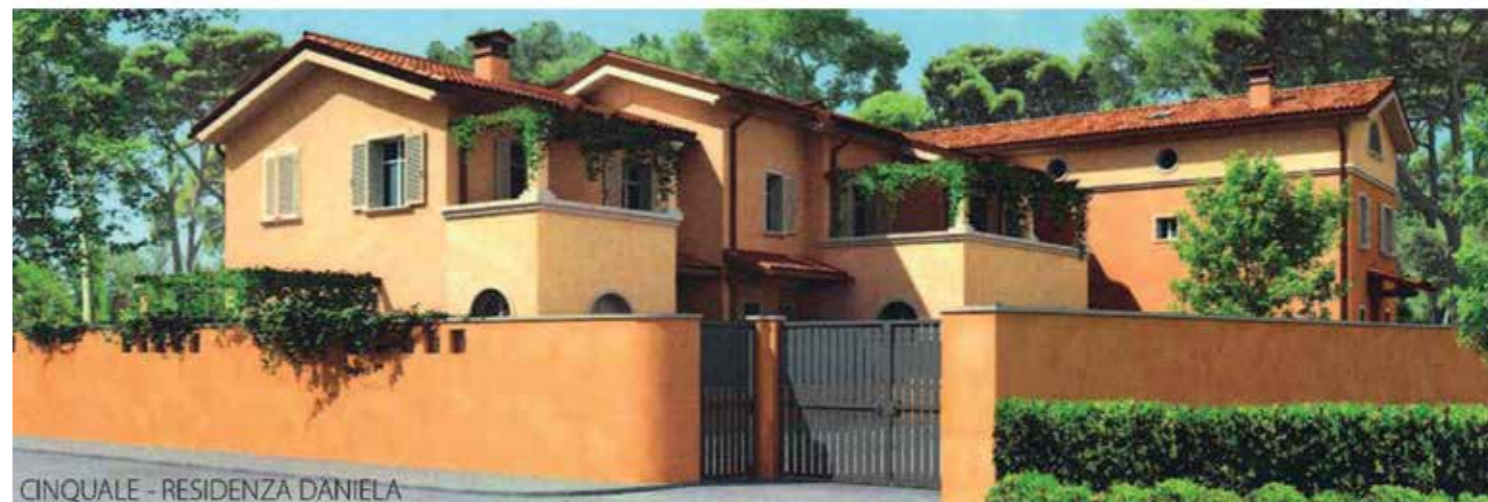
CINQUALE - RESIDENZA DANIELA