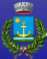
Comune di Beinasco