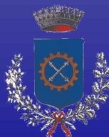
Comune di Bruino