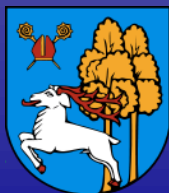
Città di Elk