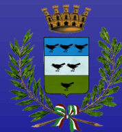
Città di Piovascico